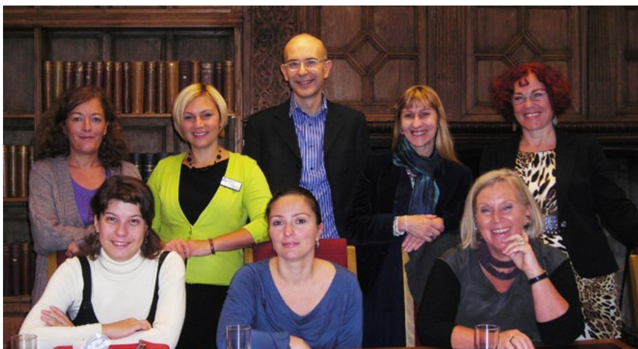
Presto-møde i Canterbury, oktober 2009

Udover implikationerne for det videre arbejde i dette projekt, er erfaringerne interessante at have med i overvejelserne, når vi udarbejder nye EU-projektidéer og beskæftiger os med tværgående undersøgelser af outcomes af EU-landenes ungdomsuddannelser, med benchmarks og med EU-policypapers.